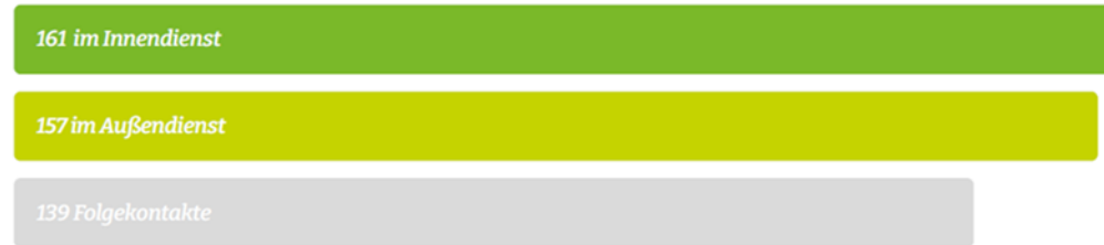
Anzahl der Beratungen im Jahresvergleich

Seit 2017 hat die Anzahl der Beratungen stark zugenommen.